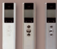
Pure Pearl Silver

Choisissez la finition qui se marie le mieux avec votre intérieur