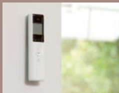
Télécommande sur le mur : mode automatique activé.

Permet de reprendre la main à tout moment sur l'automatisme soleil.