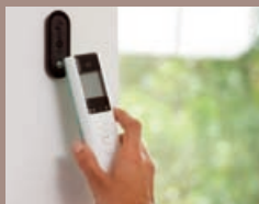
Télécommande prise en main : mode automatique désactivé.